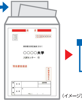
出願書類提出用封筒宛名表